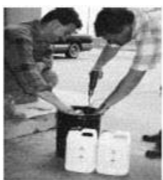
Mistura dos componentes