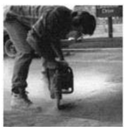
Preparação da superfície