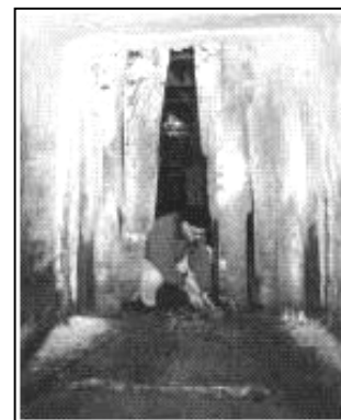
Preparação para o tratamento SUB-ZERO ®

A SUB-ZERO ® foi criada para proteger as bordas de juntas serradas e de construção e para reparar trincas e danos causados por tráfego de empilhadeiras e outros veículos.