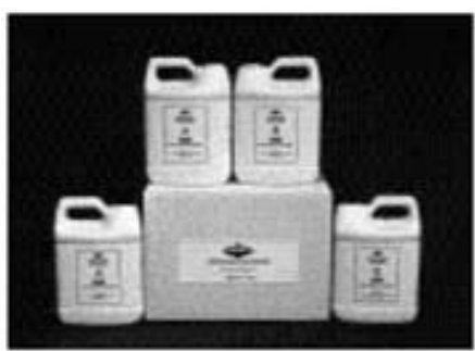
Kit com 2 galões (1 gal de A e 1 gal de B)